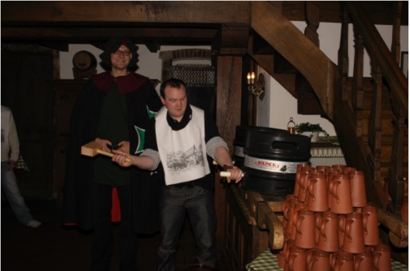
Waldhotel Lingen*** Emsland total mit Ritterschmaus all-inclusive, Kornbrennern und mutigen Jünglingen