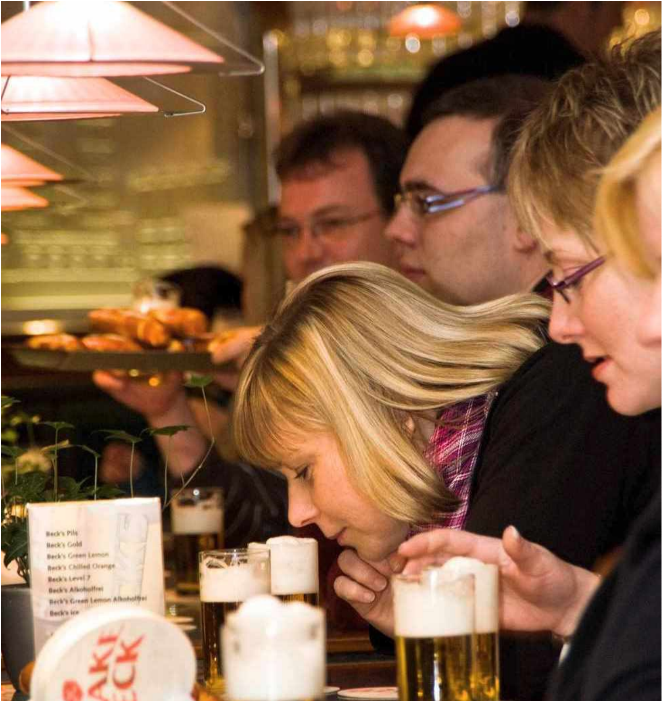
B&B Hotel Bremen Hbf **S Schauriges und Schönes in Bremen - Krimi, Knast und Bierbrauer-Kunst