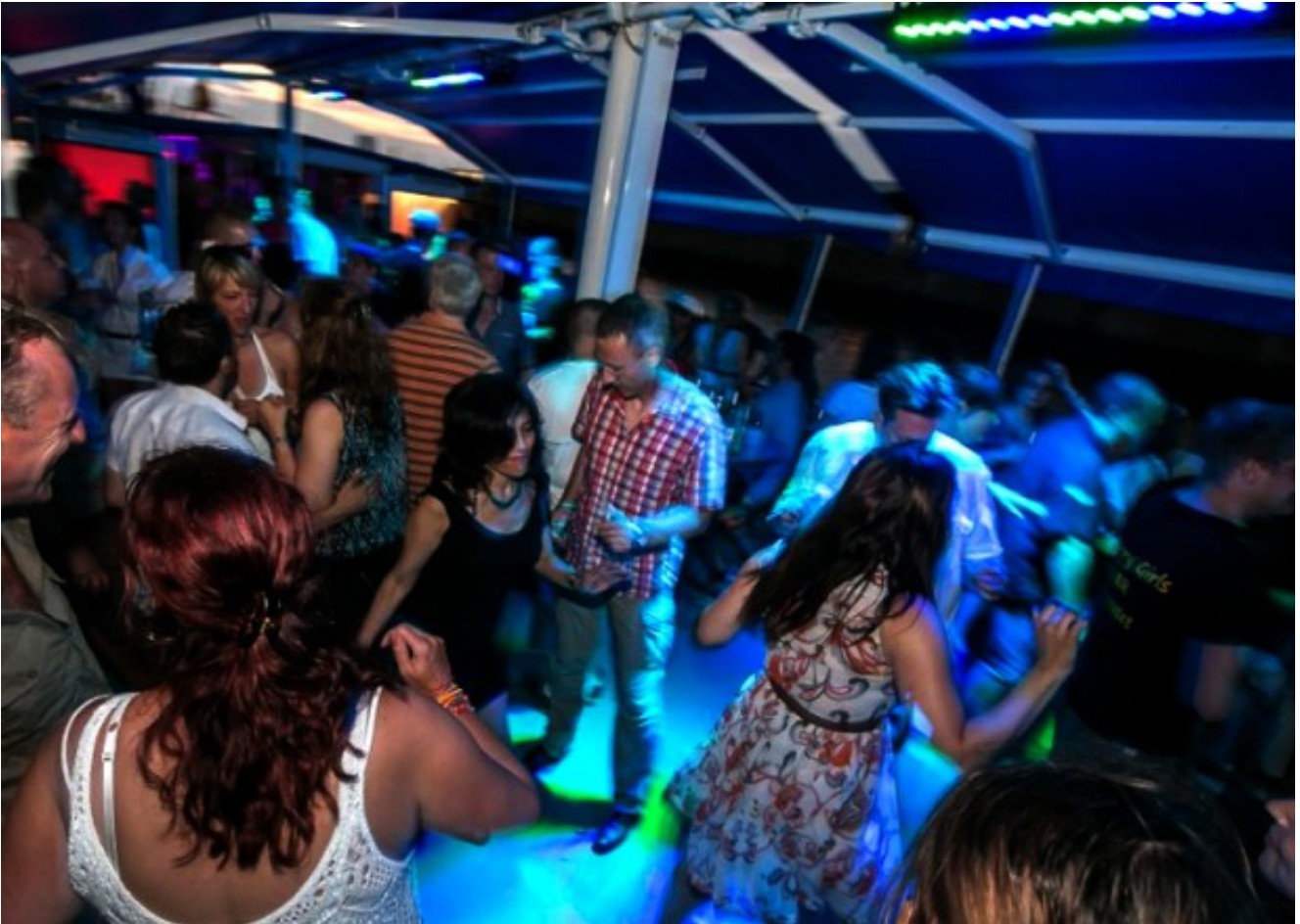
Motel one am Michel*** Hamburger Highlights mit Bordparty all-inclusive und St. Pauli-Streifzug