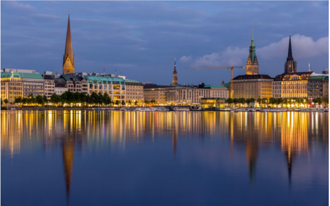
Motel one am Michel*** Hamburg mit Dämmertörn auf der Alster und seinen schönsten Seiten