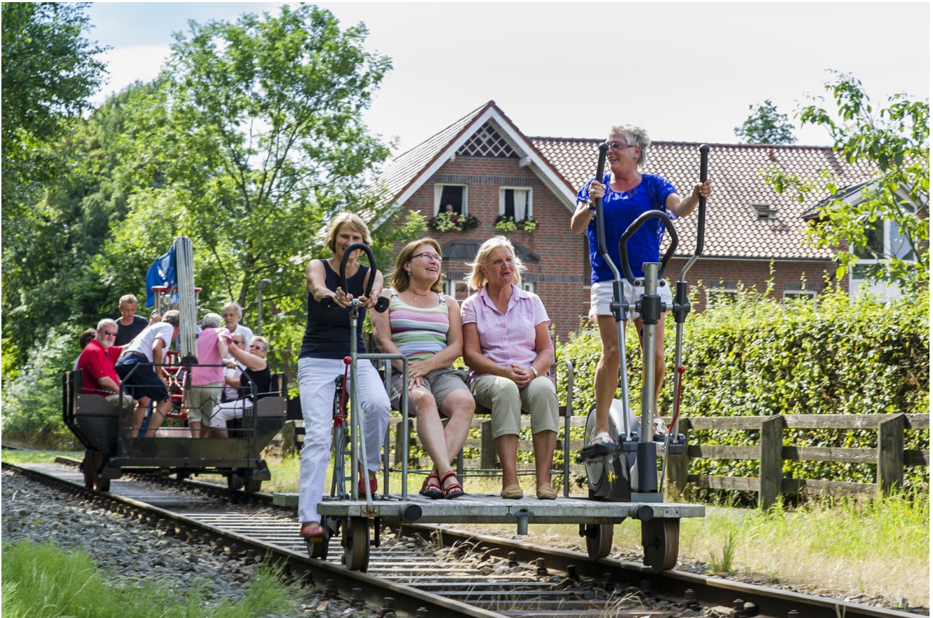
Mit Volldampf und Draisine durch das Hasetal