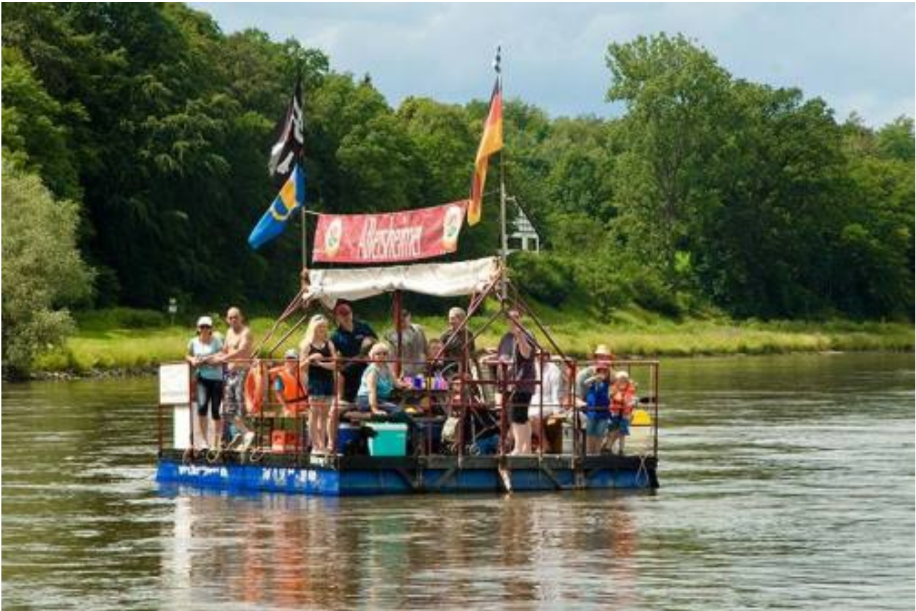
Hotel zur Börse *** Floß ahoi auf der Weser mit Floßfahrt all-inklusive