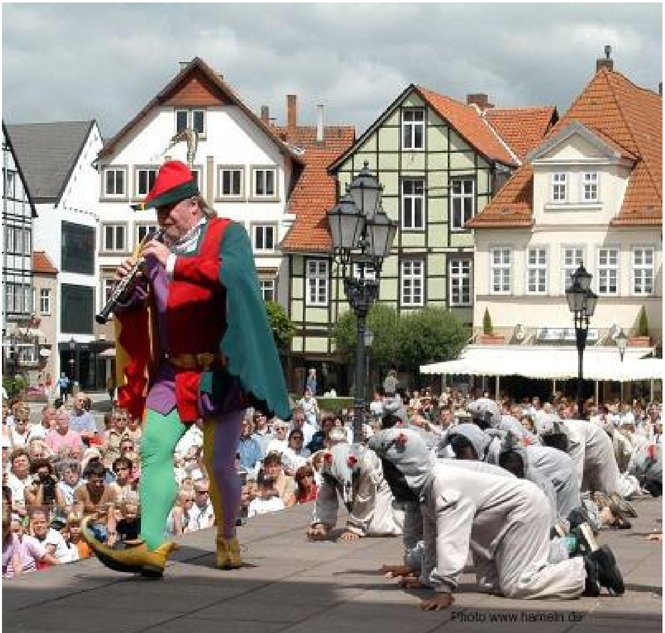
Hotel zur Börse *** Hamelner Highlights oder auch Hamelner Allerlei