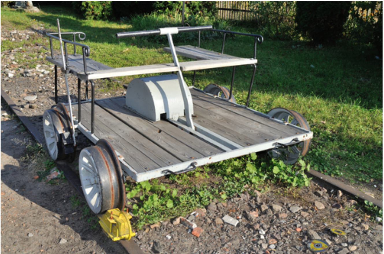
Hotel Tiek*** Mit Volldampf und Draisine durch das Emsland