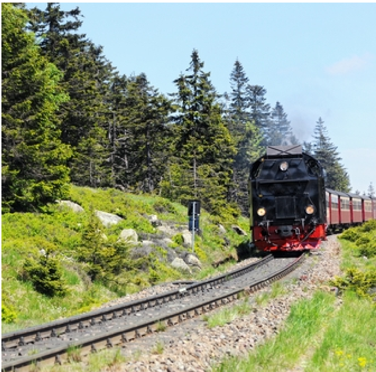
Hotel Median *** Im Harz hoch hinaus mit Brocken-Tour, Ritterabend all-inclusive und Hexenspuk