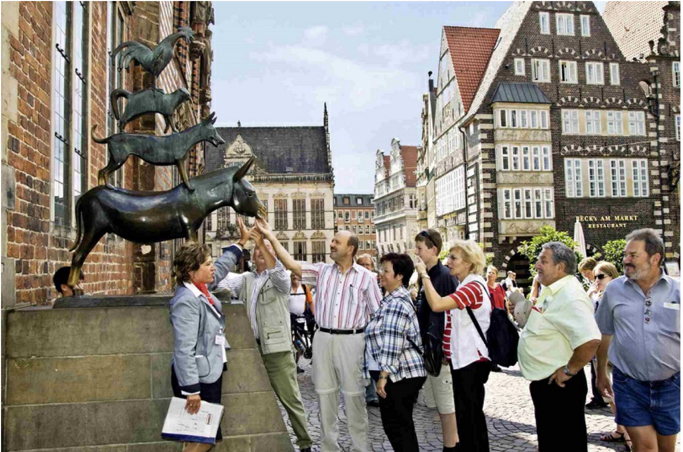
Hotel Heldt *** Tierisch tolle Tage in Bremen mit den Bremer Stadtmusikanten höchstpersönlich