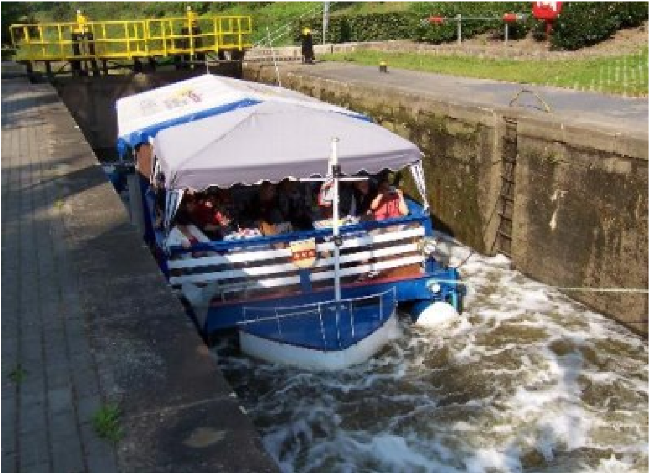
Hotel Gasthaus Thien*** Schiff ahoi auf der Ems mit Floßfahrt und Landbüffet all-inclusive