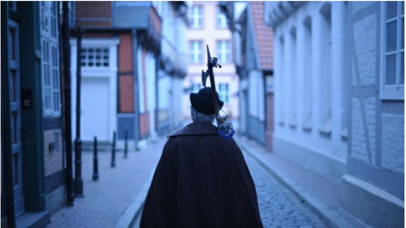
Hotel am Braunen Hirsch*** Von Herzögen, Heide und Bierbauern im alten Celle