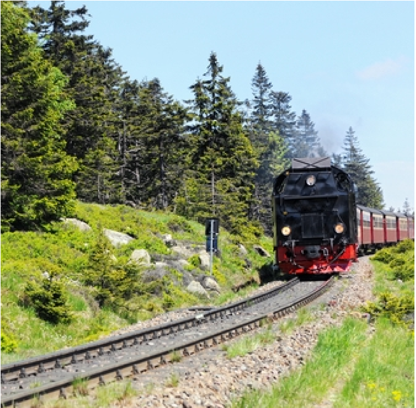
Hotel Alt Wernigeröder Apparthotel *** Im Harz hoch hinaus mit Brocken-Tour, Ritterabend all-inclusive und Hexenspuk