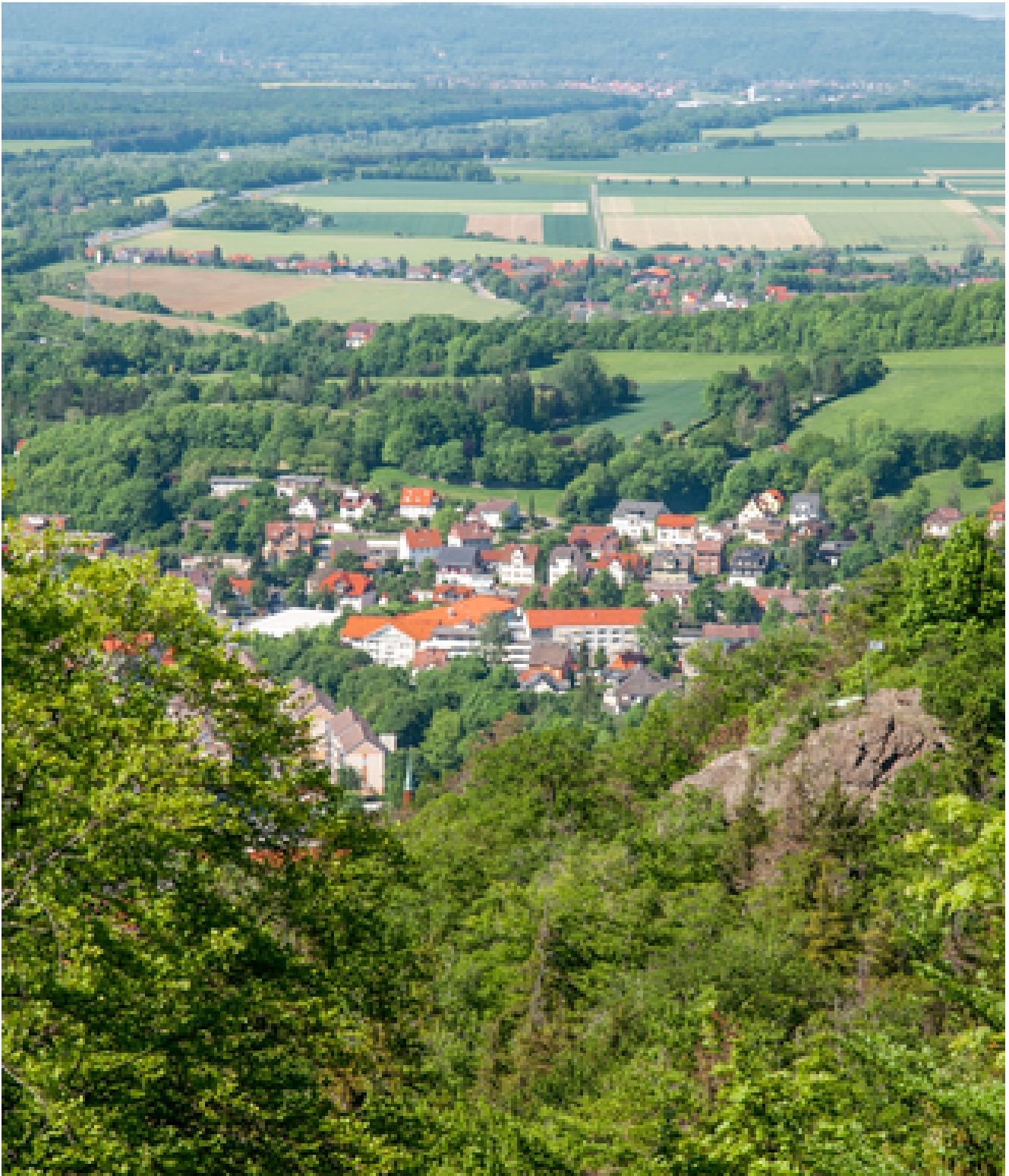
Hotel Alt Wernigeröder Hof *** Harzer Allerlei mit Spanferkelparty