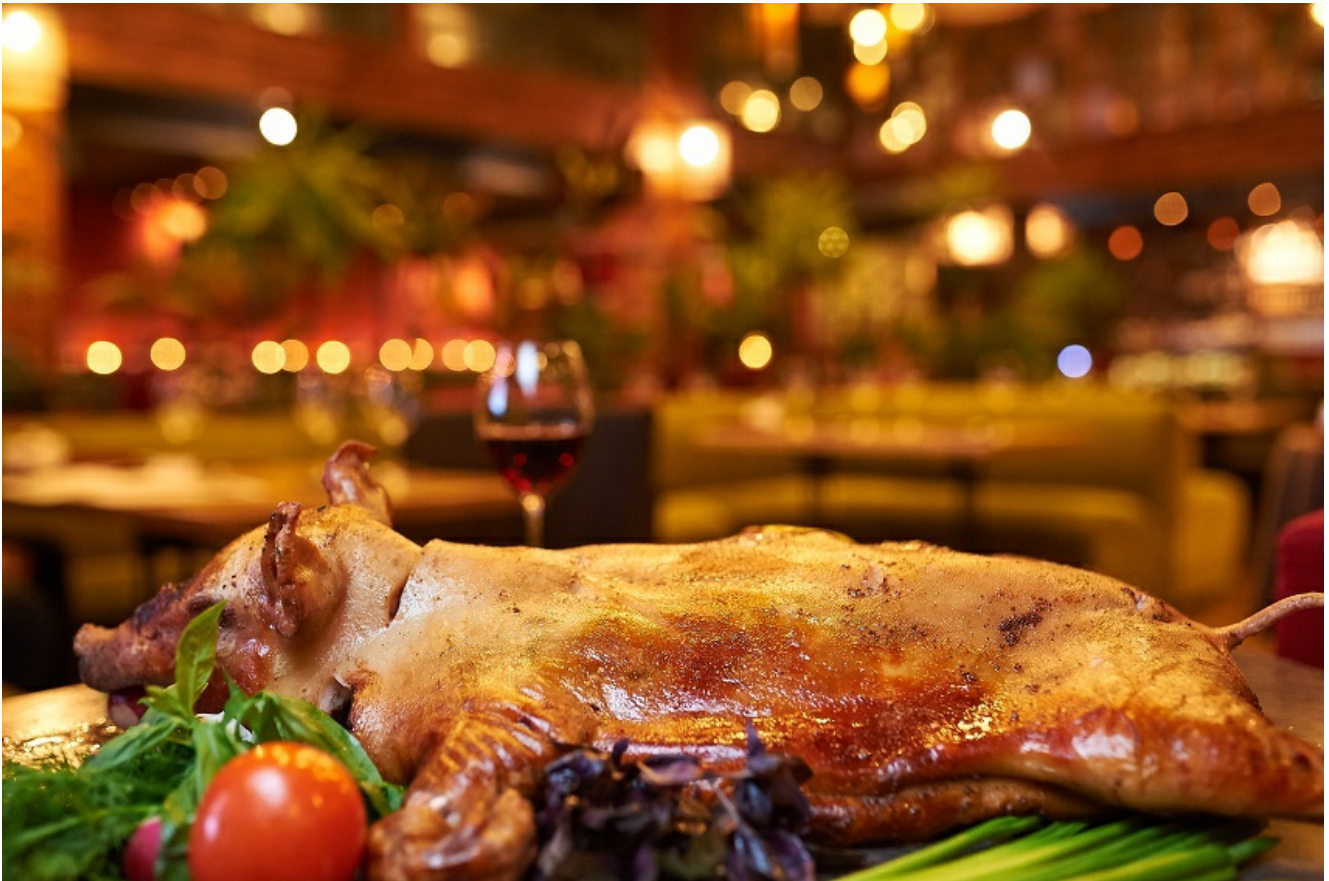
Hotel Ambiente *** Harzer Highlights mit Bowlingsause und Spanferkelparty all-inklusive