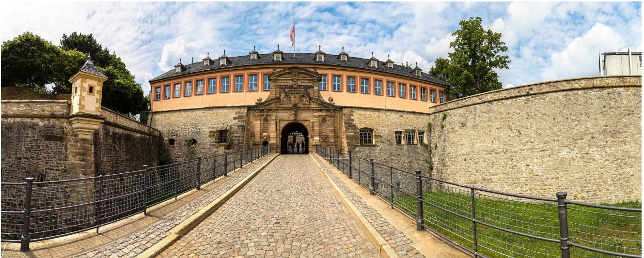
B&B Hotel Erfurt ** Erfurt-mittelalterlich und köstlich