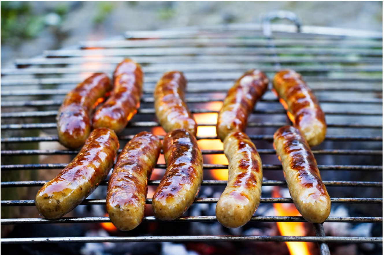
B&B Hotel Erfurt ** Erfurter Bratwurstgeschichten - Hier dreht sich alles um die Wurst