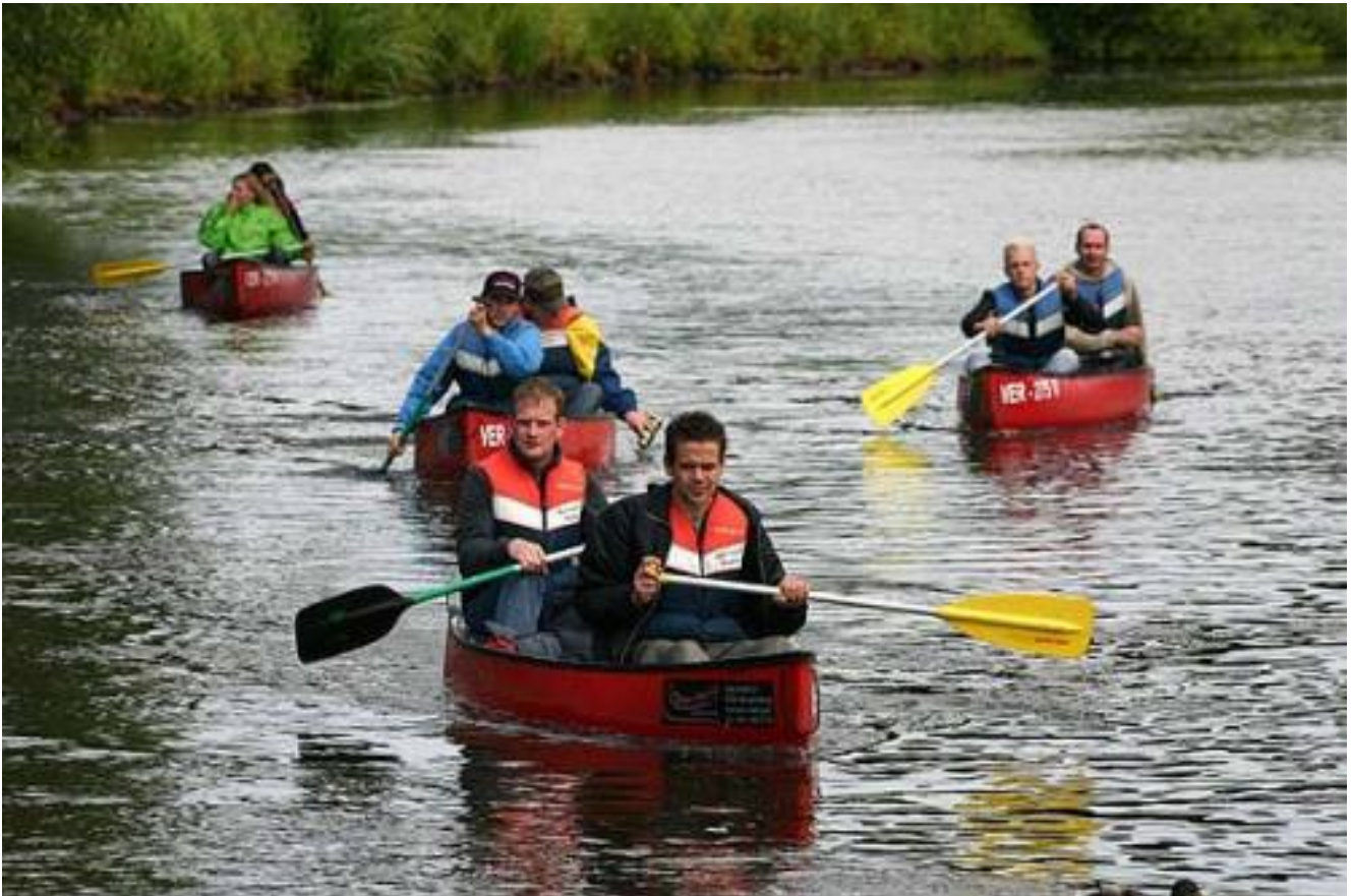
Dschungelsafari mit zünftiger Heidjer Grillsause und Kanutour auf der Aller